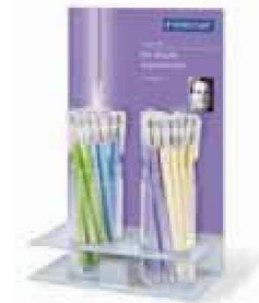
Expositor Metallic Collection