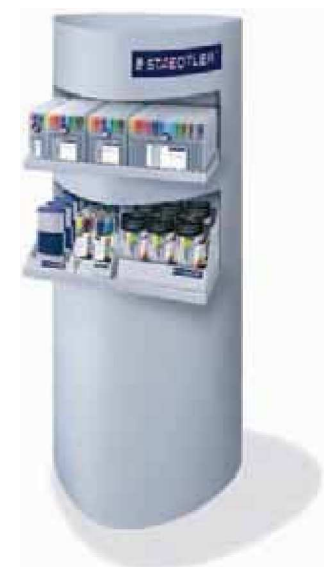
Expositor de piso con paquete de productos