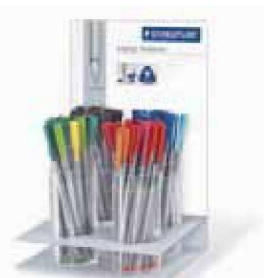
Expositor con 60 bolígrafos