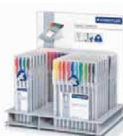
Expositor de estuches