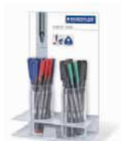
Expositor con 30 bolígrafos

compactos para estantería y mostrador, para colocar en el punto de venta bolígrafos sueltos y cajas STAEDTLER, adecuados para todos los comercios. Los nuevos expositores STAEDTLER ofrecen óptimas posibilidades de presentación para los productos triplus, con un noble diseño que ya están disponibles.