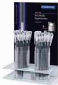
Expositor Black Collection

noble y brillante. La disponibilidad de los expositores para el comercio es la misma que la de los productos de las distintas colecciones.