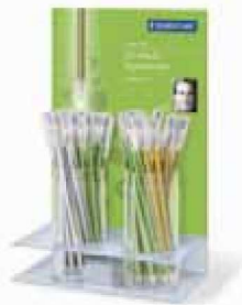
Expositor Decor Collection